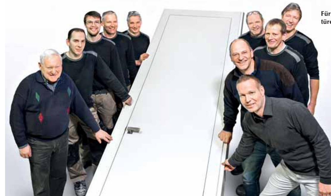
Für das BTM-Team können Innentüren nicht groß genug sein!