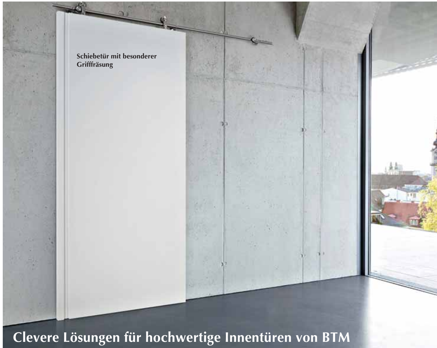
Schiebetür mit besonderer Grifffräsung